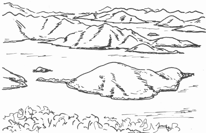
若 松 瀬 戸